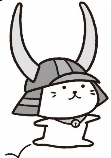
彦根市キャラクター 「ひこにゃん」