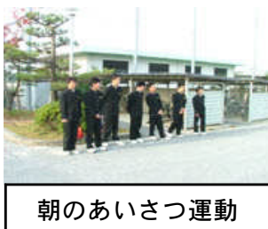
朝のあいさつ運動