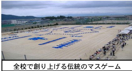
全校で創り上げる伝統のマスゲーム