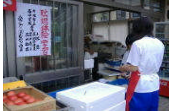
生徒会 Wash&Cleanデー 夏季総体壮行会